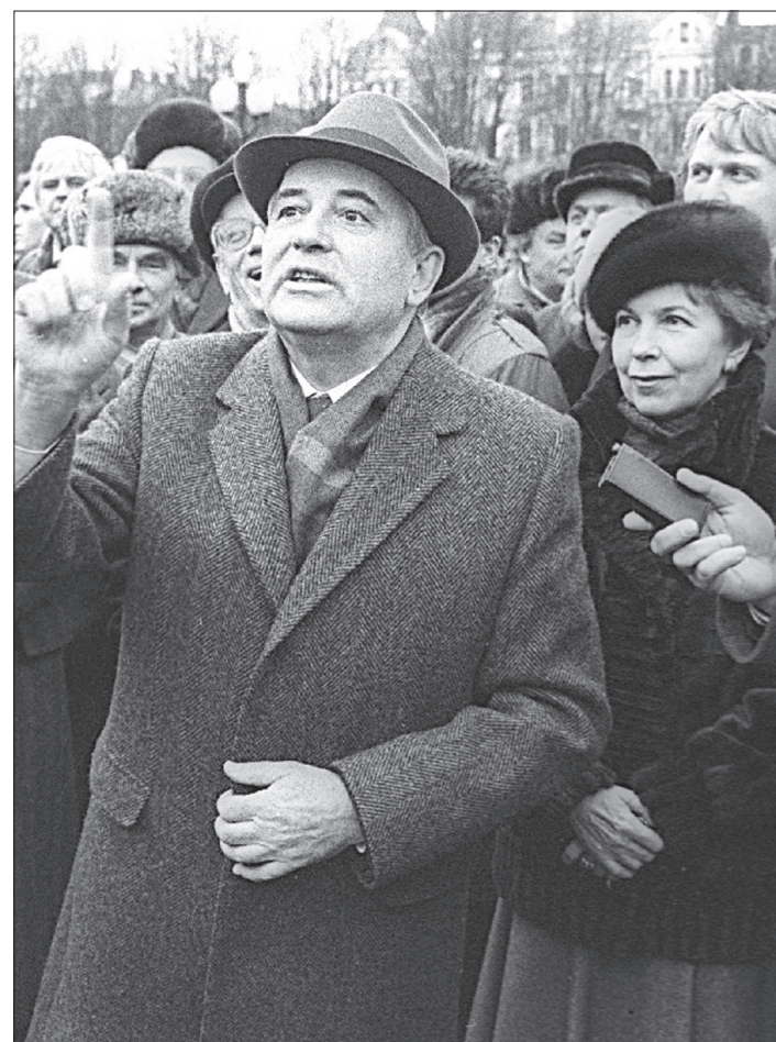
► VEIDRODIS. Kalbant apie Lietuvos vaizdą, jis stubinamai primena tai, kas vyko prasidėjus Michailo Gorbačiovo perestroikai iki Sąjūdžio (1990 m. sausio 11 d., Vilnius)

tu, kai centrinėje sovietų spaudoje virė karštos diskusijos dėl perestroikos prasmės ir tikslų, buvo kalbama apie aštriausias šalies problemas, Lietuvos žiniasklaida ir socialiniai mokslininkai toliau mechaniškai kartojo sovietinės ideologijos frazes. Ir šiandien nors didžioji Vakarų žiniasklaidos dalis sovietiniu stiliumi švaistosi nacionalizmo, populizmo ir panašiomis ideologinėmis etiketėmis, tikrai galima rasti straipsnių, kurie objektyviai ir pakankamai giliai nušviečia dabartinės krizės priežastis. O Lietuvoje nėra bent kiek gausesnių tokių straipsnių vertimų. Mūsų žiniasklaidoje